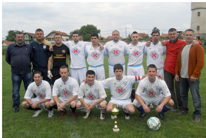
ФК Раднички ПДМ

Раднички ПДМ: Милошевић 7, С. Милановић 7, Марковић 7 (В. Милановић 7), Баралић 7,5, Павловић 7,5, Суботић 7,