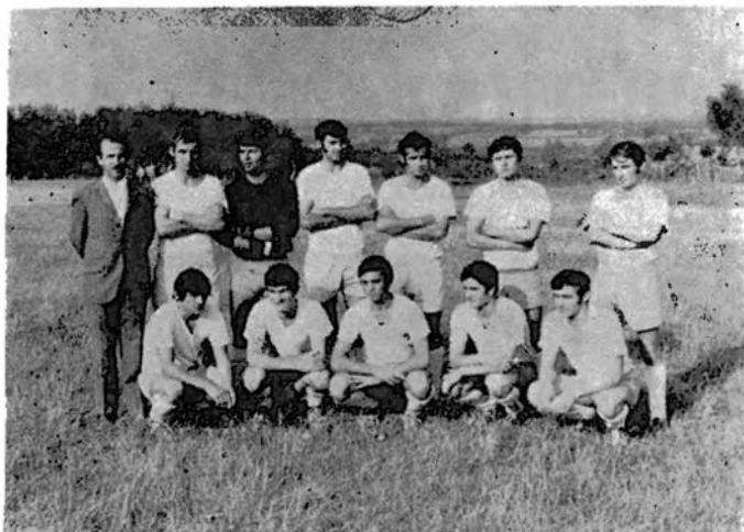
ПОБЕДНИК ДЕРБИЈА: Младост из Ковачевца