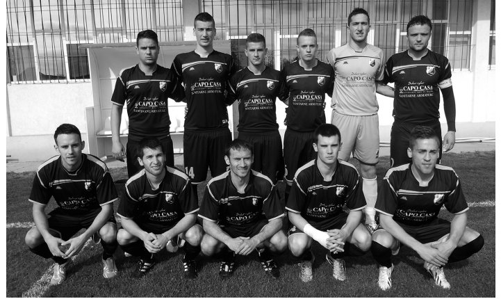
ФК ШУМАДИЈА - Јагњило