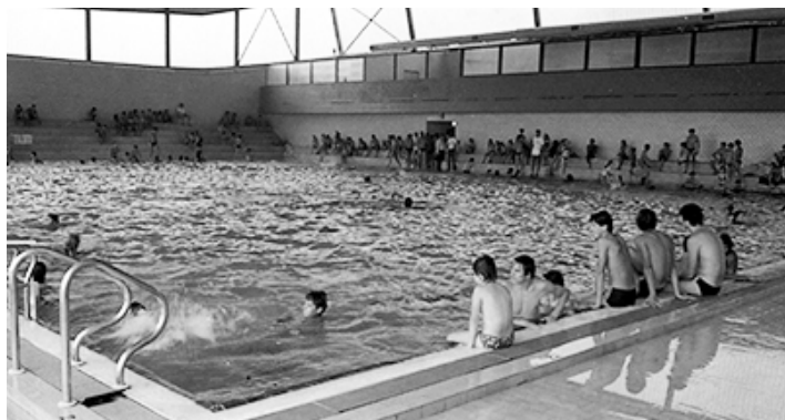
Ошваране базена 8. августа 1982. године

У младеновачком Спортском центру „Љубомир Ивановић Геца“ одвијају се припреме за почетак нове купалишне сезоне. Нова сезона почиње 16. јуна, а ни ове године неће изостати бесплатна школа пливања која ће се одвијати у неколико група полазника. Иако је пре две године реновиран мали базен, тренутни изглед СЦ „Љубомир Ивановић Геца“ овог лета одлази у заборав, јер ће наредне године почети целокупно реновирање овог спортског здања које је пуштено у функцију 8. августа 1982. као установа за вршење јавне службе у области физичке културе.