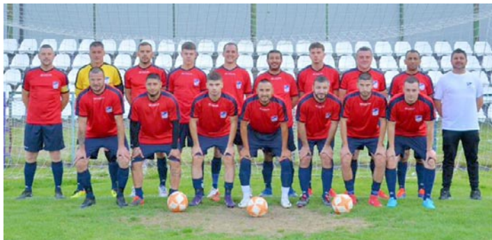
Репрезентација Сопота, џобедник џурнира

Током протеклог викенда у Сопоту је одржан је 45. мајски турнир фудбалски селекција приградских општина Београда, који је окупио селекције Лазареваца, Барајева, Гроцке, Обреновца, Младеновца и Сопота. Реч је о турниру који је заживео давне 1977. године на иницијативу Фудбалског савеза Обреновца и од тада одржава се последње недеље маја.