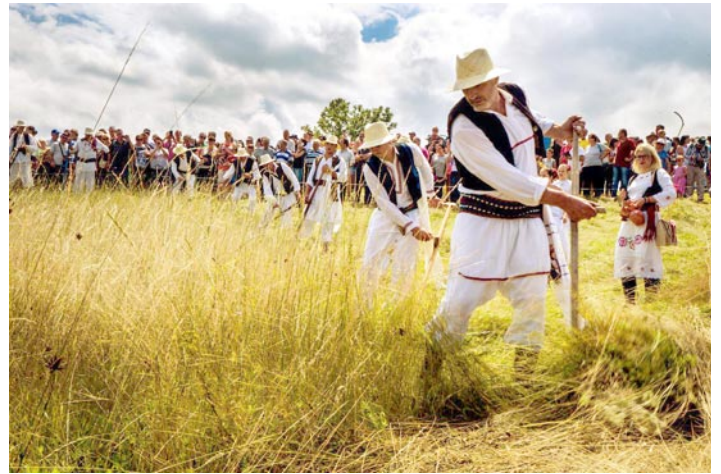
Овако је, некада, излегала моба у Србији

- Сетили смо се прича наших родитеља и бака- како се некад косило, брало грожђе, дизао кров... Помагало се. Сви су знали кад се шта ради. Ми смо данас изгубили ту нит, али је жеља остала. Само треба нов начин повезивања. Са једне стране су људи који имају потребу за радницима- било да је реч о радовима у пољу, берби воћа, кречењу, чишћењу тавана, или пак селидби. Са друге стране су они који желе да раде- млади, студенти, људи из руралних средина, па и пензионери. Послодавац поставља оглас- шта треба урадити, кад, где, под којим условима. Радник се пријављује, без посредника, провизије и додатних трошкова- додаје он. До сада се пријавило 350