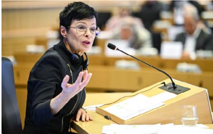
Marta KOS

Поводом студијских пројеката у Србији се ојасила Марта Кос, комесарка за проширење