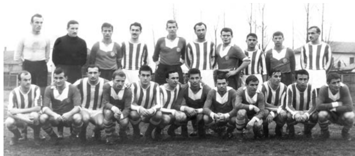
ОФК Младеновац (ђрујасџи гресови) уочи 1/16 финала Куђа Југославије са Челиком из Зенице, 16. децембра 1962. њодине