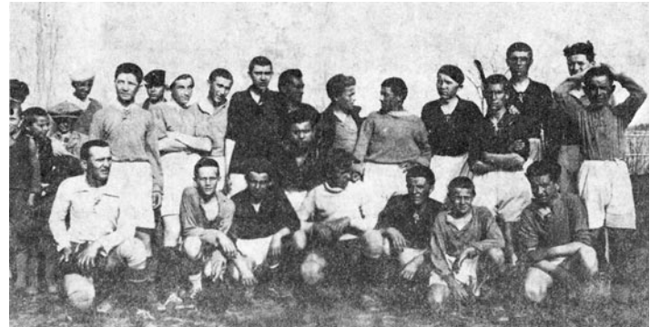
Заједнички снимак СК „Војводе Катића“ (свејли гресови) и СК „Јуте“, 1940.