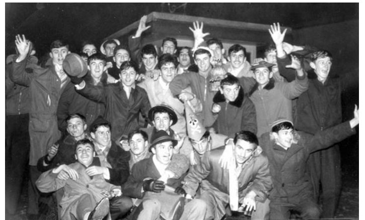
Група младих Младеновачана после дочека Нове 1962. године