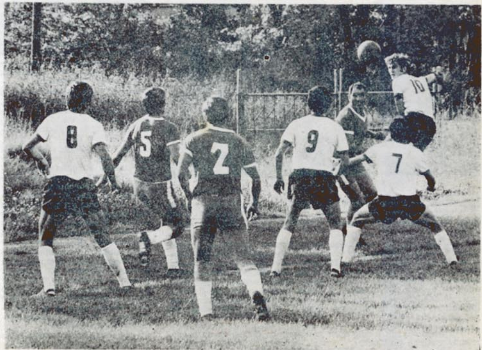
Раднички је против Вице постигао још једну високу победу

Спортишки временелов: Пре 53 године изашао је број 4. „Младеновачког спорта“ који је излазио од 17. септембра до 8. октобра 1971. године. Ово је насловна страна броја 4.