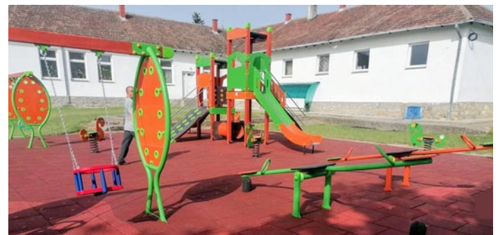
Ново, модерно дечје игралиште добили су и најмлађи ситановници Дубоне.