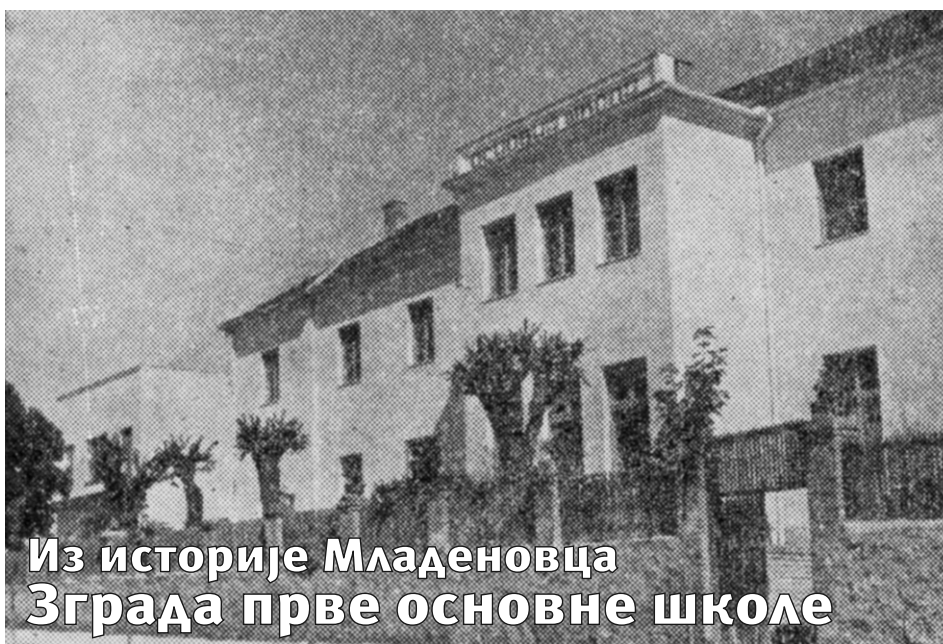
Из историје Младеновца Зграда прве основне школе