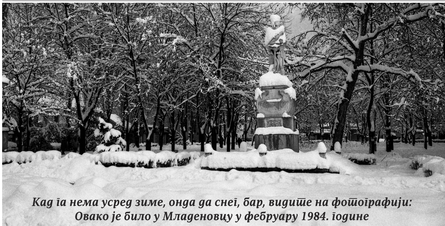
Каг ја нема усред зиме, онда да снеї, бар, видише на фоџоїрафији: Овако је било у Младеновцу у фебруару 1984. іодине