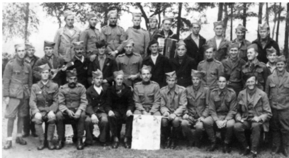
Српски војници у заробљеништву

Кад смо изашли на брдо, појавише се три немачка авиона. Командант пука види на двоглед чији су авиони. Имају црне крстове. Ђутимо. „Наши авиони“. Ђутимо. Пустише три рафала. Изгунули ту неки, неки рањени. Официр не каже да су то Немци. Преноћим у Малом Иванчи. Ујутру се појави мајор са стражом и пита ко је у Раљи. Почеше д иду немачки моторцикли. Јуру за Београд. Пуцају наши. Немци се не обазиру. (наставак у следећем броју)