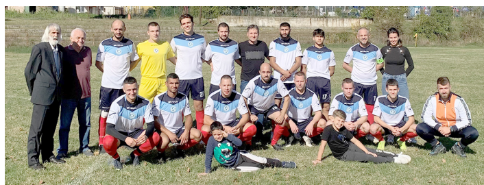
Младеновац, 2023. године: ОФК Студент

Најдража му је велика повеља Градске општине у знак признања за афирмацију младеновачког спорта кроз новинарски и публицистички рад. Поред писања и спорта, озбиљно се бавио и колекционарством. Поседује породичну библиотеку са позамашним бројем књига, вредну збирку значкица домаћих и страних фудбалских клубова, сређених по лигама, разгледнице градова из целог света (око две хиљаде) и комплет ЦД-а на којима су снимци мечева ОФК Младеновца из времена када је био члан Прве лиге Србије (Друга лига).