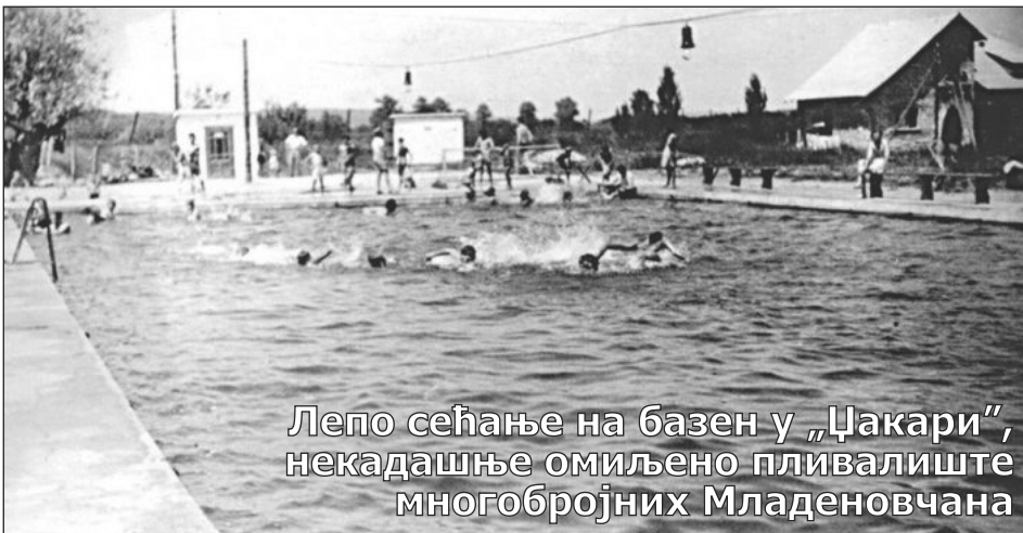
Лепо сећање на базен у „Џакари“, некадашње омиљено пливалиште многобројних Младеновчана

Могуће је да кандидата има и на још некој листи, али због начина уписивања места боравка, нисмо били у могућности да проверимо да ли је неко од предложених из Младеновца.