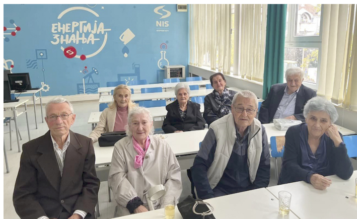
Генерација мајмураната младеновачке гимназије 1957. године прославила је 66 година мајмуре