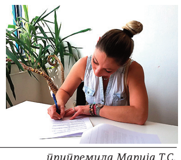
припремила Марија Т.С.