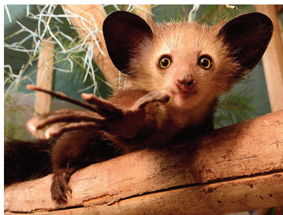
припремила Марија Т.С.

Куцка по дрвећу тражећи бубе, па их онда вади својим дугим средњим прстом из коре.