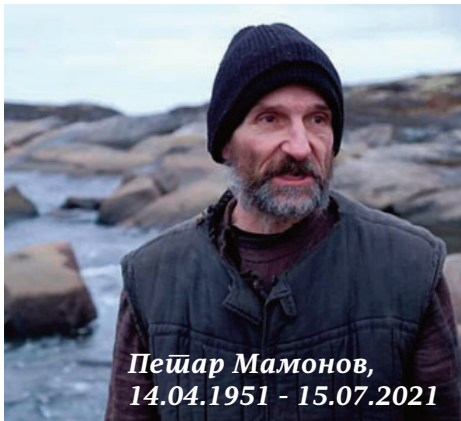
Петар Мамонов, 14.04.1951 - 15.07.2021