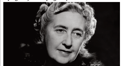
ѡрипремила Марија Т.С.

Сјајно је имаши мужа археолога, сваке године му њосиђајеш све вреднији и вреднији.