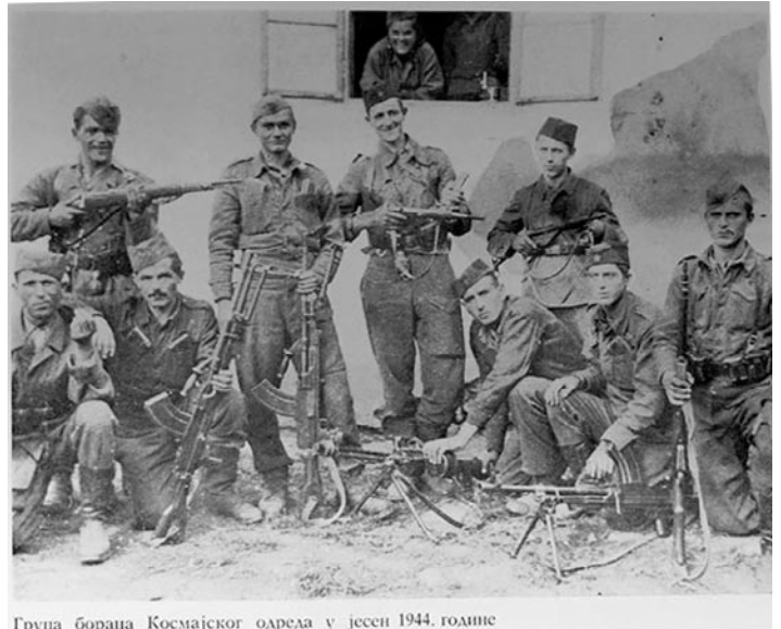
Група бораца Космајског одреда у јесен 1944. године