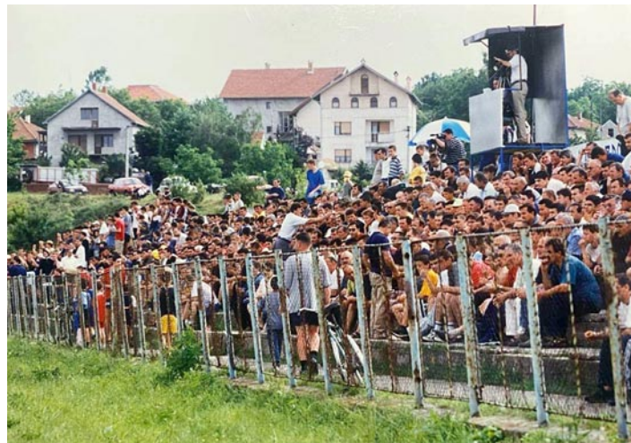
Давно је љрошло време када је фудбал љеган

Како објаснити незаинтересованост Младеновачана за спортска дешавања? Поразно је и да се на утакмицама одбојкашког клуба у другостепеном српском надметању окупило једва педесетак гледалаца иако су се нашли на корак до најеминентнијег националног такмичења. На рукометним и кошаркашким мечевима је још мање публике, па се намеће питање: А, шта ли је са родбином, члановима породице или другарима младих кошаркаша, односно рукометаша? Да је свако од њих на утакмицу повео по два гледаоца слика са утакмице колико-толико била би другачија. Политичари би можда рекли како младеновачким клубовима недостаје оно што они називају сигурним или капиларним гласом.