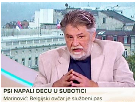
PSI NAPALI DECU U SUBOTICI Marinović: Belgijski ovčar je službeni pas

Вест да су два пса, истог власника, за неколико дана, напала седморо деце у Суботици, узнемирила је јавност. Пси су брзо склоњени са улице али су остала отворена питања: како се и зашто то догодило, шта је изазвало агресију паса, које грешке прави човек у таквим тренуцима и, наравно, ко је крив и одговоран за нападе власничких паса? У овом суботичком случају, неодговорни власник пустио је два белгијска овчара, малиног, на улицу и догодил се, током само неколико дана, више напада на децу. Чињеница да су се ови белгијски овчари, иначе службени пси, нашли сами на улици, готово у центру Суботице, довољно говори о несхватљивој неодговорности власника тих паса. Јер, бити одговоран власник пса, без обзира била то мала чивава или неки велики или службени пас, значи да морамо, у сваком тренутку, да будемо одговорни и знамо где су и шта раде наши пси. То показује и до које мере се, у нас, олако схвата власништво паса. Нажалост, ни као друштво нисмо много урадили на едукацији људи када је реч о држању и узгоју паса. Годишама изостаје та васпитна компонента та-