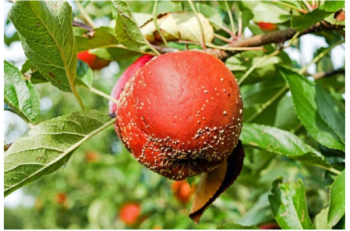
Јабuka инфицирана љивом Monilinia laxa

Заштита од монилиоза није једноставна и захтева примену како агротехничких, тако и хемијских мера. При подизању воћњака треба бирати пропусне терене где је олакшано проветравање, а редове постављати у правцу доминантних ветрова ради боље аерације.