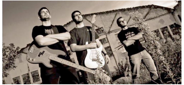
Младеновачка трија COTTON PICKERS

- Није таква врста музике где девојке могу да баце део своје гардаробе на бину, мада се дешавало, али ја сам се увек музиком због бавио музике али било је