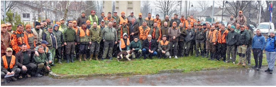
Младеновачки ловци пред полазак у хајку на лисице и шакале