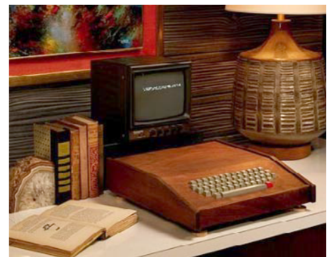
припремила Марија Т.С.

Мојао бих да ова ипачања нижем бесконачно и све би то биле сјајне шеме за истраживање. Све ово се мора зајамити. Доћи ће дан и остарићеш, ако све ово сазнаш и зајамитиш, осећаћеш се као да живиш хиљаду година.