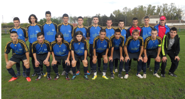
ФК Село Младеновац