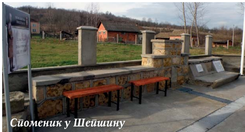
Споменик у Шешину