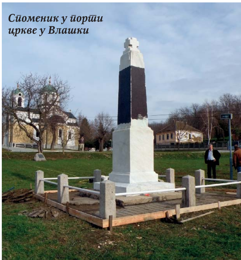
Споменик у порти цркве у Влашки