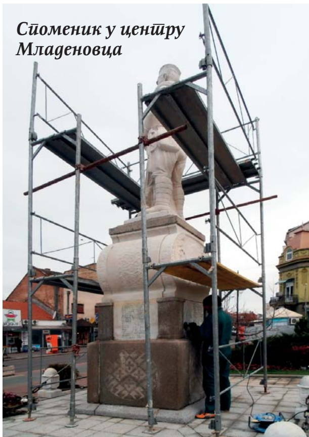
Споменик у центру Младеновца