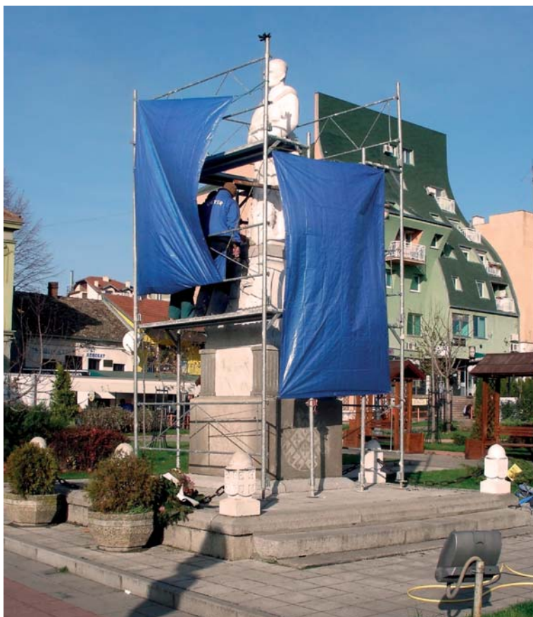
Споменик јунацима ослободилачких ратова од 1912 - 1918. дејално је, после многа година, ојран и очишћен