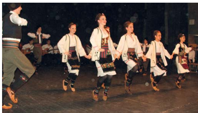
КУД „Шумадија“ из Влашке одржао је у сали Центра за културу концерт за памћење. Извештај и фотографије на страници 16.