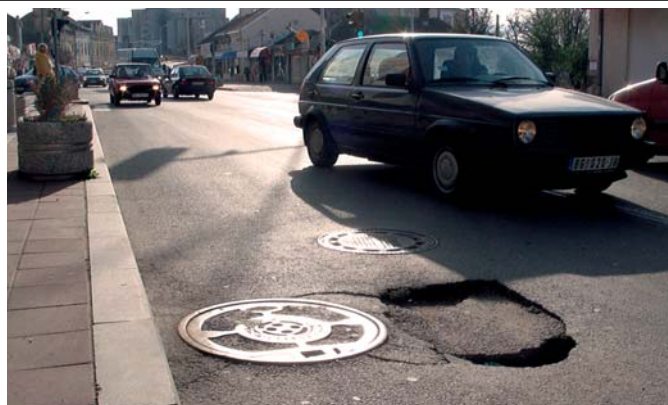
Руиа на коловозу у Главној улици сваким даном је све дубља и већа! Ко је надлежан да је закрпи?