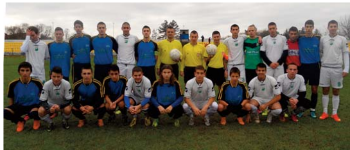
Омладинци ОФК Младеновац и Жаркова (ОФК Младеновац је у њавим дресовима)