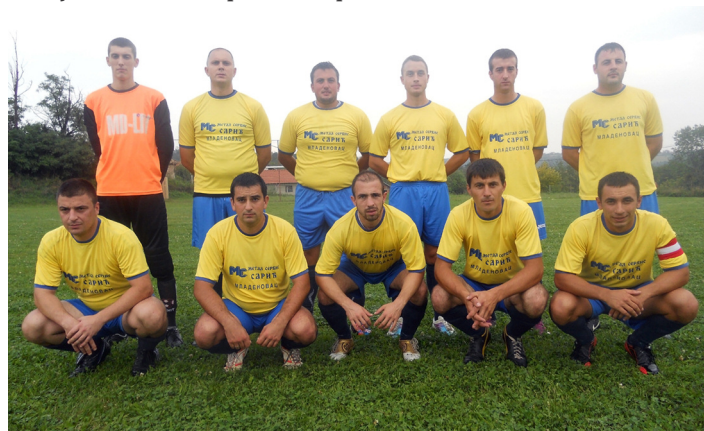
ФК Омладинац Рајковац