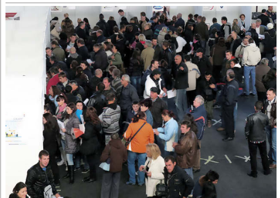
Одржан Сајам запошљавања