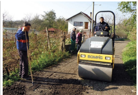
Асфалтирање путева у Међулужју сјрана 7