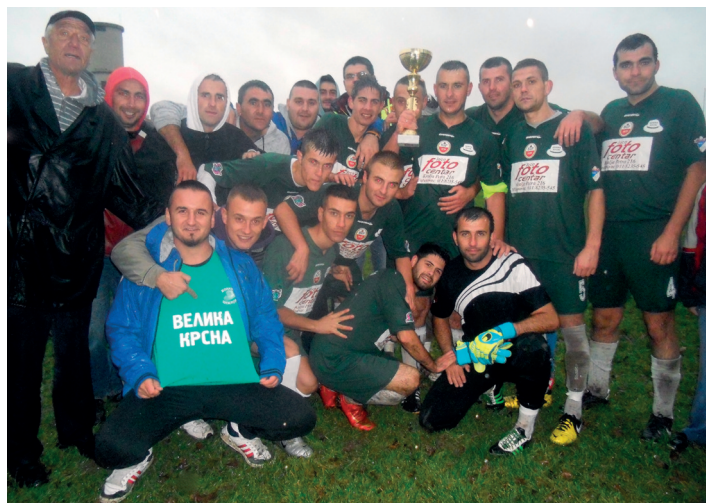
Победници купа - ФК Велика Крсна