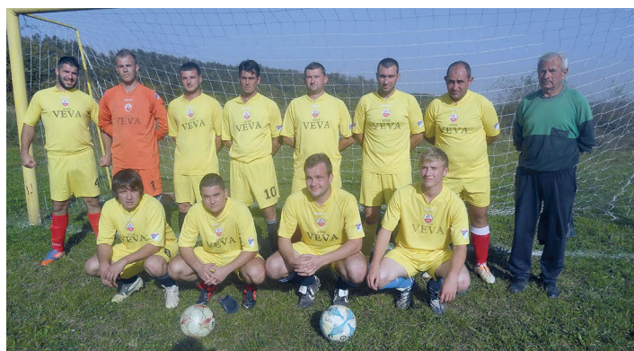
ФК НАПРЕДАК Дубона