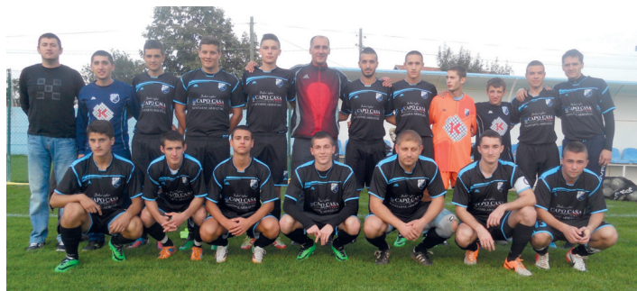
ФК ШУМАДИЈА 1962 Јањило