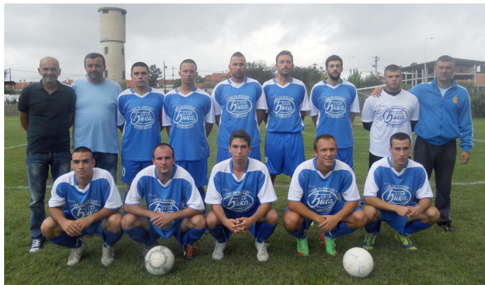
ФК Село Младеновац