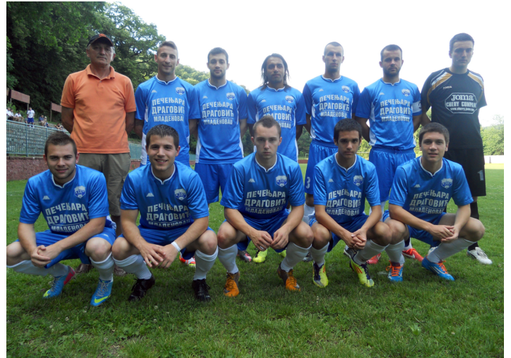
ОФК Младеновац - сезона за заборав

Шумадија из Јагњила је резултатима и пласманом у сам врх лествице београдске српсколигашке групе показала да је реч о озбиљном и стабилном клубу. Црне гласине везане за фузију и пад у општинску лигу већ дубоко потресају људе привржене за клуб који је изградио леп стадион на „Јасику“.