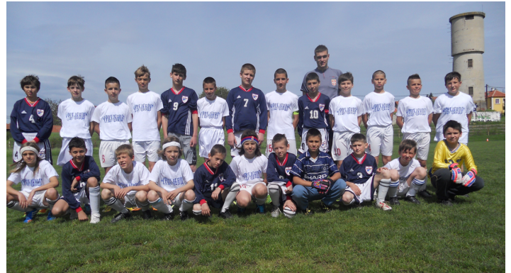
„Пејлићи“ ОФК Младеноваца и Село Младеноваца

Резултати последњег, 14. кола: Напредак (Међулужје) - ОФК Младеновац 1:12, Дедиње - Студент 2:3, Влашка - Село Младеновац 5:2, Велика Крсна - Раднички ПДМ 3:1.