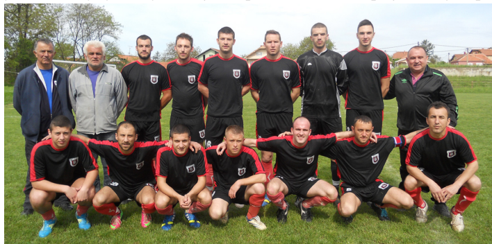
ФК Напредак (Међулужје)