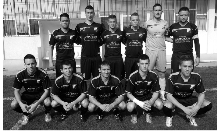
ФК ШУМАДИЈА - Јагњило